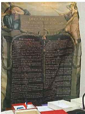
DDHC de 1789

Ce sont les citoyens qui contrôlent l'action du maire. Ce pouvoir de contrôle découle directement de la Déclaration des Droits de l'Homme et du Citoyen de 1789 (article 15 « La société a le droit de demander compte à tout agent public de son administration »).