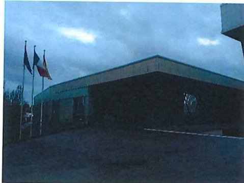
Mairie de Woustviller

Les habitants de la commune peuvent facilement venir prendre un rendez-vous et rencontrer le maire à la mairie (qui est un peu comme une maison) pour discuter avec lui. Le maire est donc accessible à tous les habitants.