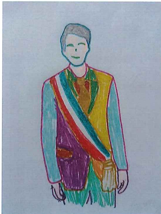
Port de l'écharpe tricolore par le maire

élèves de la classe de CM1/CM2 de Mme Thomas Maude