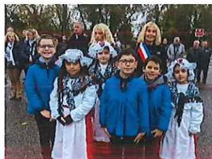
Cérémonie du 11 novembre (année 2023)