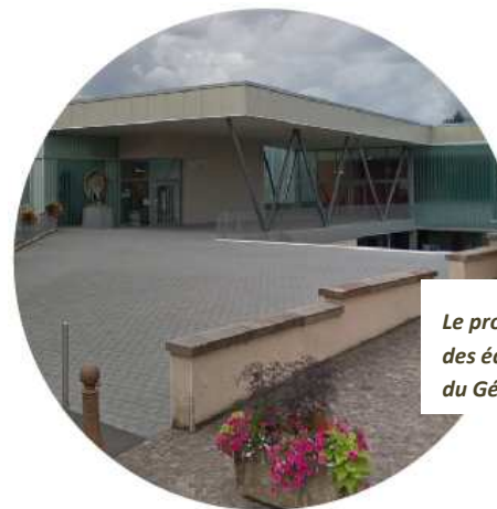
Le projet communal vise à assurer l'accueil des équipements notamment sur la place du Général de Gaulle

La collectivité, outre ses projets de redéploiement du centre bourg, a également des besoins à plus court terme en matière d'équipements publics pour assurer les besoins de ses habitants. Elle poursuit donc l'amélioration et/ou le développement de son niveau d'équipements.