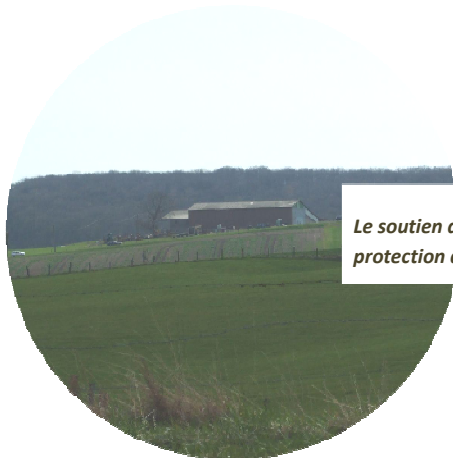
Le soutien de l'économie agricole passe par la protection des exploitations mais aussi des terres

Les élus ont donc souhaité affirmer la protection des potentiels agronomiques par :