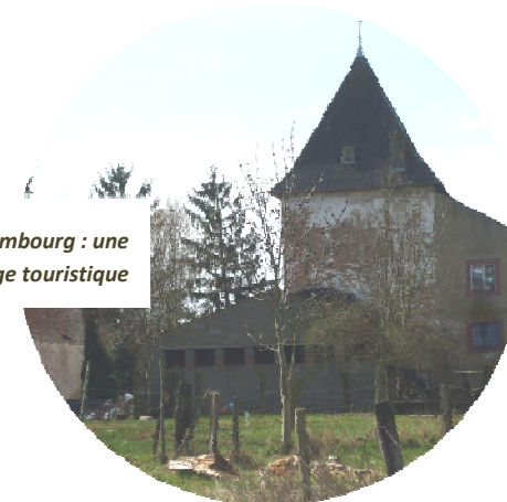
La ferme du Chambourg : une réhabilitation pour un usage touristique

Si le projet reste à définir (chambres d'hôtes, ferme-auberge...), la commune marque clairement cette volonté en réservant spécifiquement cet espace pour une vocation touristique. Ce projet s'inscrit pleinement dans la volonté communale de diversification de son économie.