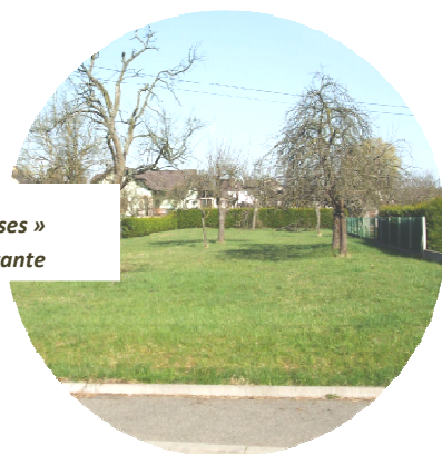
L'urbanisation prioritaire des « dents creuses » au sein de l'enveloppe bâtie existante

Le présent projet a pour objectif de diminuer la consommation de l'espace par notamment :