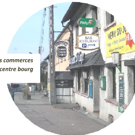
Le soutien et la valorisation des commerces du centre bourg

Aussi, la démarche municipale s'inscrit en faveur :