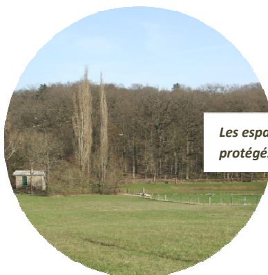
Les espaces boisés : des réservoirs de biodiversité protégés