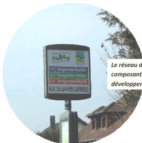
Le réseau de transport en commun : une composante importante de la stratégie de développement communal

La commune est desservie par trois lignes de transport en commun dont l'une dessert le centre bourg (rue de Nancy) qui permettent de rejoindre facilement le centre de Sarreguemines.