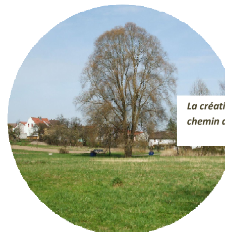
La création d'un parc en cœur de bourg, le long du chemin de vie