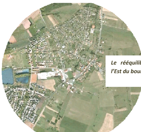
Le rééquilibrage de l'agglomération sur l'Est du bourg

Le diagnostic a montré que le développement urbain des 40 dernières années s'étant concentré sur la partie Ouest de la RD674 et du centre bourg, l'agglomération se trouvait aujourd'hui déséquilibrée par une partie Est limitée à quelques constructions en bordure de voies. Au fil des ans, le centre bourg originel a su garder sa vocation de pôle d'équipements et de commerces mais les habitants s'en sont peu à peu éloignés ayant pour conséquence la multiplication des déplacements motorisés.