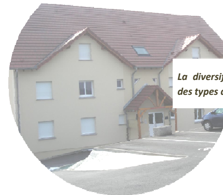
La diversification des formes urbaines et des types de logements

Les projets urbains futurs devront offrir des formes urbaines et des types de logements diversifiés (appartements en collectifs, maison de ville sur de petites parcelles, maisons individuelles...) pour permettre d'accueillir aussi bien des jeunes en début de parcours résidentiel, que des familles ou des personnes âgées.