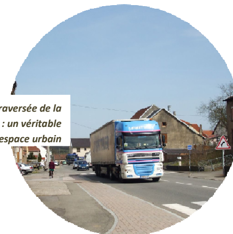
La requalification de la traversée de la RD674 après la déviation : un véritable espace urbain

La commune est traversée par la RD674 qui supporte un trafic important et qui est devenue une véritable coupure dans le tissu urbain. Source de nuisances, manquant d'aménagements qualitatifs et sécurisés, cette pénétrante au cœur du bourg met la voiture au premier plan et la vie de village au second. Le Conseil Départemental projette, à moyen terme, de dévier la RD674 vers le Sud évitant ainsi le passage dans le centre de Woustviller.