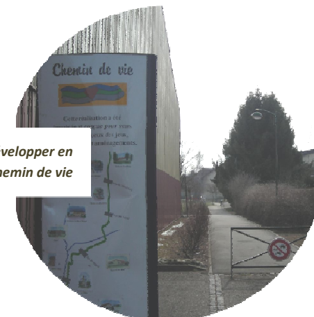
Un maillage de circulations douces à développer en connexion avec le chemin de vie