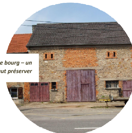
Les vieilles maisons du centre bourg – un patrimoine peu présent qu'il faut préserver

L'ambition du projet communal vise à promouvoir la préservation et la valorisation des quelques éléments patrimoniaux. En effet, le centre bourg étant très limité, les traces de l'histoire de Woustviller sont peu nombreuses.